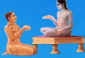
గురు కుక మహర్షి