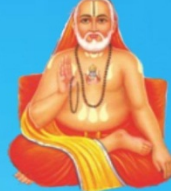
గురు రాఘవేంద్ర స్వామి