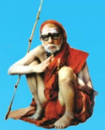
గురు చంద్రశేఖర పరమాచార్య