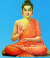
గురు గోతమ బుద్ధ