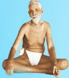
గురు రమణ మహర్షి