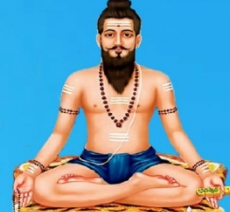
గురు వీరబ్రహ్మేంద్ర స్వామి