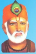
గురు కబీర్ దాస్