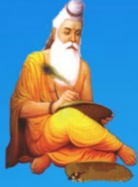
గురు వేదవ్యాస మహర్షి