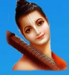
గురు నారద మహర్షి