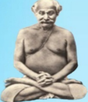
గురు లాహిరి మహాశయ