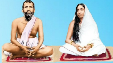
గురు రామకృష్ణ పరమహంస, అమ్మి శారదాదేవి