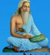
గురు వాల్మీకి మహర్షి