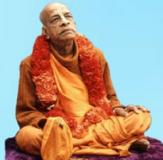
గురు భక్తవేదాంత ప్రభుపాద