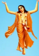
గురు చైతన్య మహా ప్రభువు