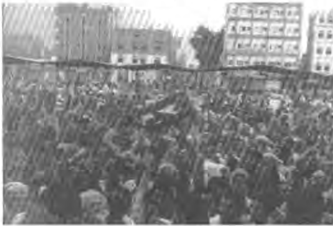
خۆپیشاندان بو داواکردنی جیا‌بوونه‌وه‌ی باشووری یه‌مه‌ن

هندی شیکردنوه و شروقه هه‌ن که ده‌لین: حکومتی یه‌مه‌نی خوی دهبه‌ویت که‌نم یاخی بوونه‌ی حوسیه‌کان به‌ر ده‌وامی هه‌بی‌ت! هۆکاری نه‌مه‌ش نه‌وه‌یه که بوونی نه‌م یاخی بوونه واده‌کات که حکومتی یه‌مه‌نی وه‌کو کارتیک‌کی پاله‌په‌ستوی به‌هه‌یز له‌ده‌ستی خۆیدا ده‌هه‌لیتسه‌وه و ده‌ستکه‌وتی نیوده‌وله‌تی پهبه‌ده‌ست ده‌هه‌نی‌ت، گرنه‌گترین ده‌ستکه‌وتیش بریتیه له هاریکاری نه‌م‌ریکی له‌وه‌ی که به‌جه‌نگی