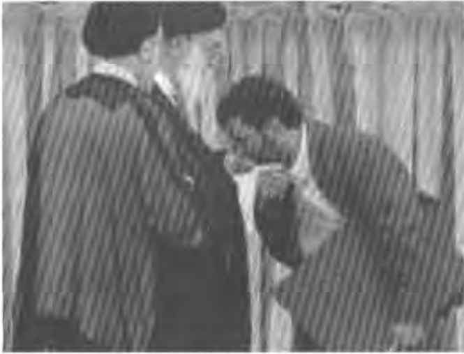
ئەخمەدى نەزاد دەستى غەلى خامەنەيى رابەرى شۆرش

ئەمانە ھەرھەمويان لە پۆلەكانى ئەم پزىمە و پشتىوانى سەرسەختى ھەموو ووتەيەكن كە لە زارى رابەرى گشتى شۆرشەو يىتە دەرەو.