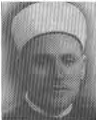
د. موسته‌فا سوباعی

زانای پایه‌به‌رز، دکتۆر موسته‌فا سوباعی (ره‌حه‌متی خ‌وای لیبت) که چاودیری نێخوانولموسلمین بوو له سوریا، له‌کاتی شه‌ری سالی