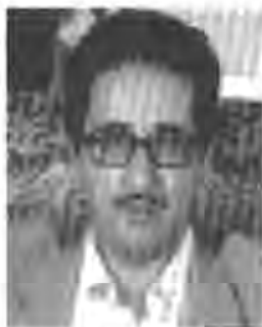
ھەسەن بەنى سەدۇر

خومەينى ھەسەن بەنى سەدۇر لەدەسەلات دوورخستەۋەو سەرۆك كۆمارىكى ترى جىنگەى ئەودا دانا!! خومەينى ئەوى لە دەسەلات دوورخستەۋە دواى ئەۋەى كە ۷۵٪نى دەنگەكانى گەلى ئىرائى بەدەست ھىنابوۋ، باشە ئەم ھەلبىزاردنە چ بەھاۋ نرختكى ھەيە؟! باشە مېزگرد ۋ تاۋتوتىكردى ھەلبىزاردنەكانى ئىزان لە ھۆكارەكانى راگەياندن لە پاى چى؟!!