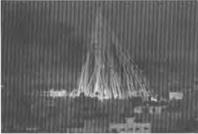
جهنگى لوبنان ۲۰۰۶

جهنگه ويرانكهره كه كوتايي پنهات و كۆمهلگه ي لوبناني توشي بارودؤخىكى ناخوشى كارلكارى يهكى نهو تو بووهوه كه هه موو بهشه كانى وولاته كه ي گرتوه، ههروهها روبه پروى هه لكشائىكى