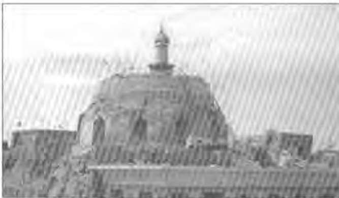
وێرانکردنی مزگه‌وتی سونه‌کان

له‌پراستیدا هه‌ندی له شیعه‌کان کۆمه‌نیستیان له‌سه‌ر نه‌و ووتارانه بو‌ ناردووین، و تییدا پووده‌که‌نه خودای گه‌وره و دو‌عا ده‌که‌ن که خودا سزامبدا‌ت به‌وه‌ی له‌گه‌ڵ نه‌بو به‌کر و عومه‌ر حه‌شم بکات!! له‌گه‌ڵ دله‌خو‌شیم به‌وه‌ی که که‌سێک هه‌یه که هیوای نه‌وه‌م بو‌ ده‌خوازت که له‌گه‌ڵ نه‌بو به‌کر و عومه‌ر دا حه‌شمبکات، به‌لام زۆریش نیگه‌رانیم