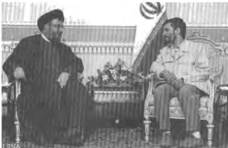
حيزبوللای کۆنترۆلی بەیروت دەکات

حيزبوللایە جەنگی ۲۰۰۶ ی زایندا دەرچوو و دەبووست بەروبوومی ئەم رووداوه گەروریە دروینە بکات، بۆیە دەستبەجێ کودەتای لەسەر ئەو حکومەتە کرد که خۆی بەشیک بوو لەو حکومەتدا، بۆ ئەم مەبەستە لە ۳۰ کانونی یەکەمی سالی ۲۰۰۶ ی زاینیدا هەلسا بە ئەنجامدانی گەردبوونویەک لەچواردووری باره گەي حکومەت و زیاتر لە ۶۰۰ خيوەتی تیدا هەلداو ئەمەش بە مەبەستی درێژەدان بە