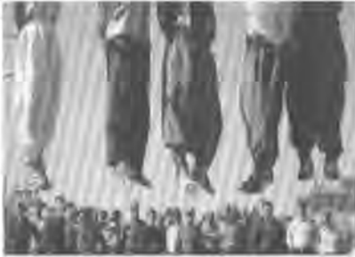
له سێداره دانی سوننه کان

مرگهوتی شیخ فهیز خۆیان له ناو مزگهوتدا قایم کردبوو.